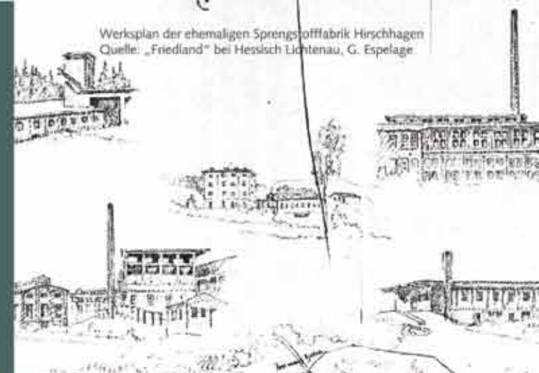
Werksplan der ehemaligen Sprengstofffabrik Hirschhagen