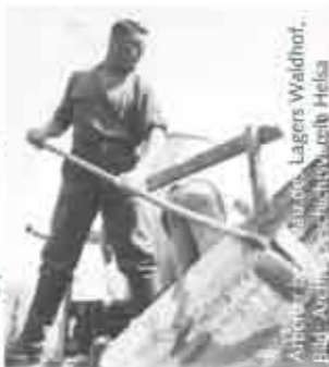
Arbeiter im Lagerwaldhof