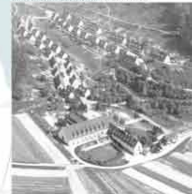
Luftbild Waldhof vor 1960